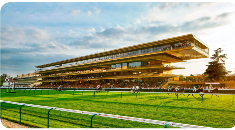
内容均经谨慎处理, 倘有错误, 乃非资料提供者意愿, 若究后果, 恕不受理。